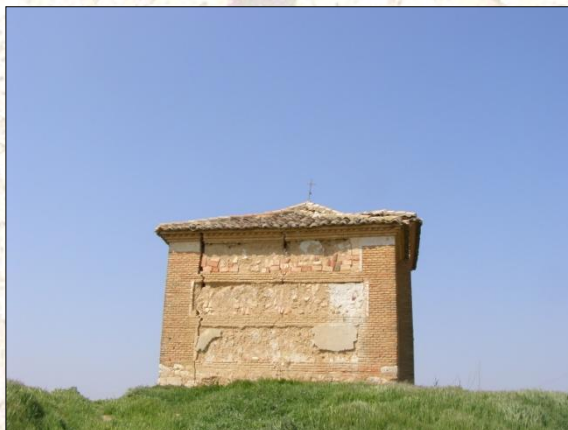
Foto 2. Ermita del despoblado de Villalinvierno

- Ermita del antiguo despoblado medieval Villalinvierno . Data su construcción del siglo XVI. En su interior se puede apreciar el retablo gótico dedicado a San Miguel Arcángel, de gran interés histórico. Se encuentra situada en una propiedad privada, por lo que la visita a su interior no es posible.