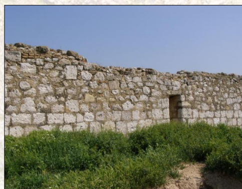
Foto 3. Ruinas del Castillo de Don Vela