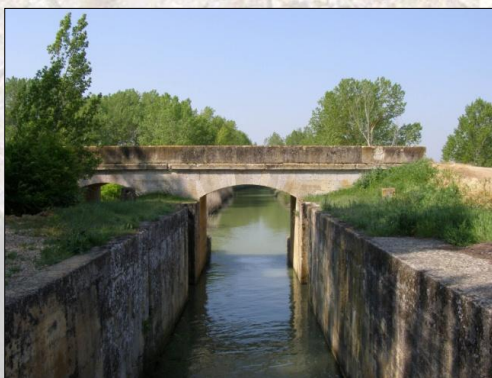
Foto 4. Puente y esclusa del Canal de Castilla

- Palomares . Existen tres palomares en la periferia de Castil de Vela. Uno de ellos se encuentra en ruinas, de otro sólo existen restos y el último se encuentra en un estado de conservación regular.